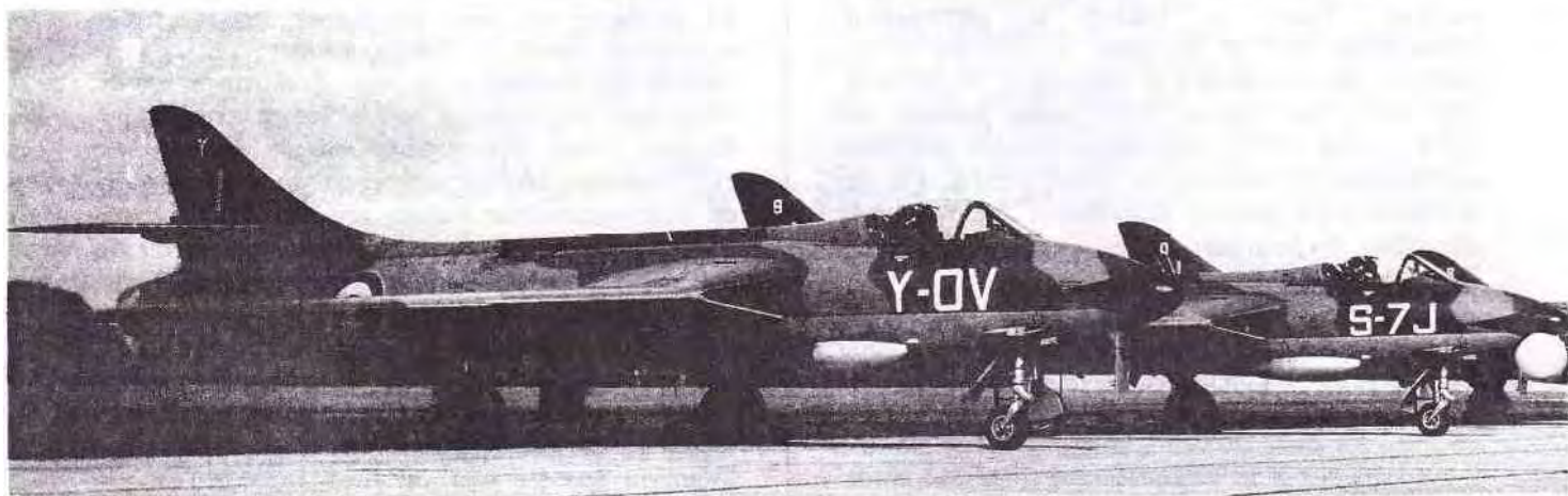
Hunter F-4 prêts à être livrés sur le tarmac de la SABCA à Gosselies Hunter F-4 panklare voor de levering op het tarmac van SABCA in Gosselies

Chez Fairey, les choses allèrent rondement : là aussi, il fallut agrandir les installations, moderniser l'outil industriel et engager du personnel, à former pour l'essentiel. En 1950, la firme gosselienne comptait 250 employés. En 1955, elle en comptait le triple.