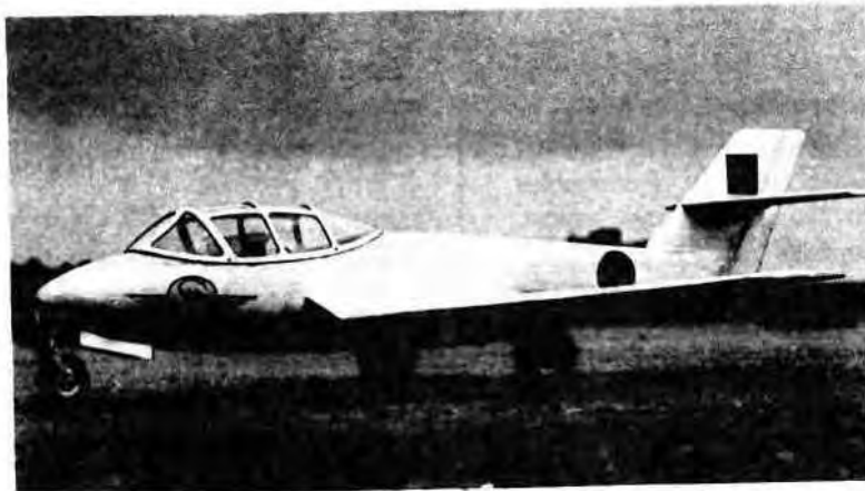
Biréacteur d'entraînement étudié par la SABCA en 1950-1951 Tweemotorig straalvliegtuig ontwikkeld door SABCA in 1950-1951

Durant cette période, l'avionneur s'occupe de révision d'instruments et des turboréacteurs Allison J-35 qui équipent les Republic F-84E et G Thunderjet reçus par la Belgique dans le cadre du programme MDAP (2) .