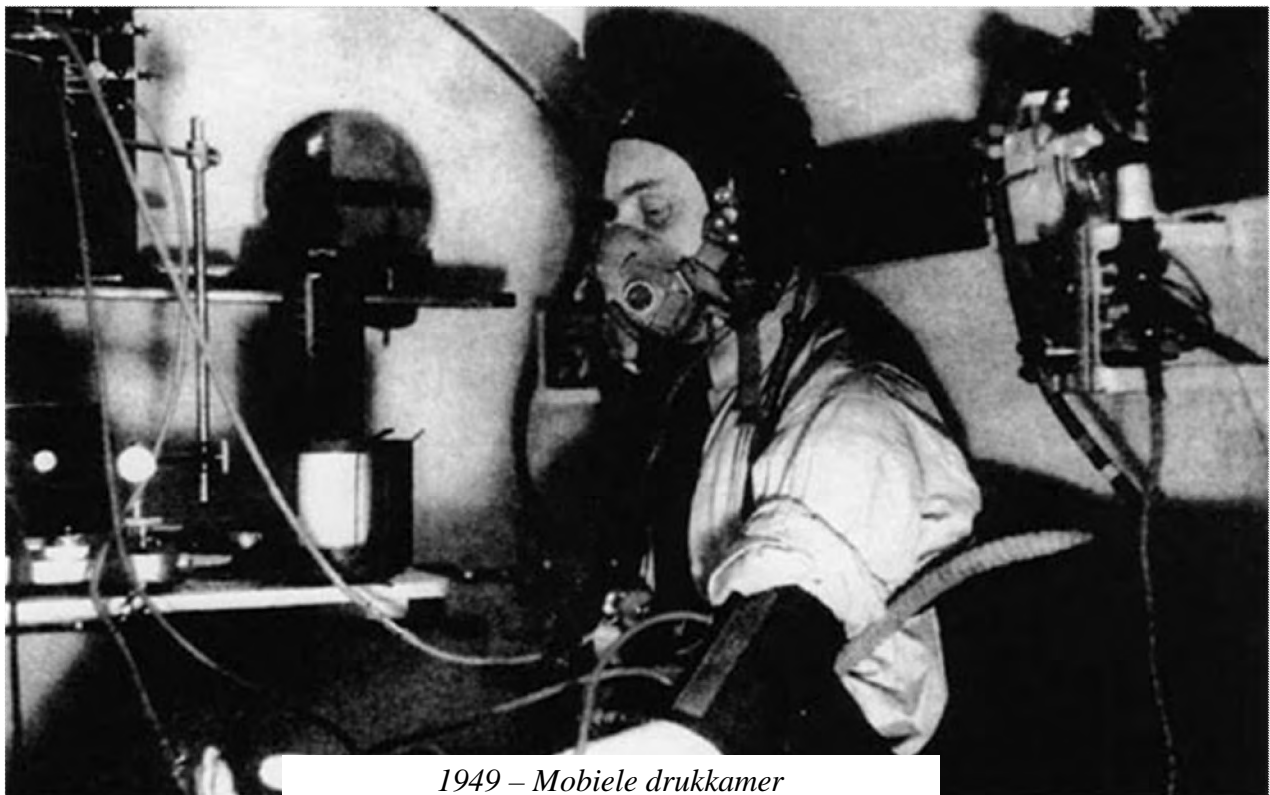
1949 – Mobile drukkamer

Deze drukkamer laat de opleiding toe van leerling-piloten in volledig veilige omstandigheden, die