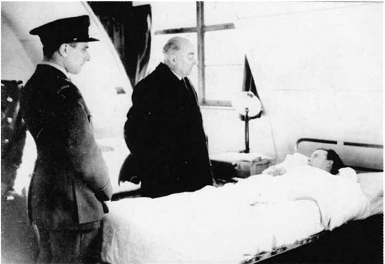
1944 – RAF Station Snitterfield, F/O Evrard begeleidt M. Hubert Pierlot, Eerste Minister, bij zijn de bezoek aan de infirmerie (Verz. MRA)