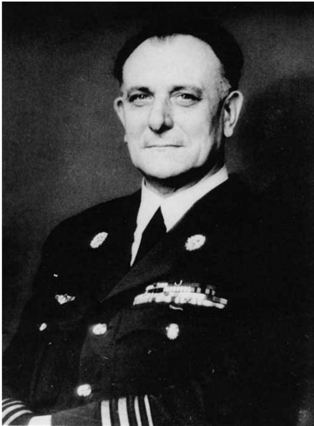
Als eerbetoon aan een eminent erelid

Zonder zijn intonatie te wijzigen noch de serene trekken van zijn gezichtsuitdrukking, deelde hij mij mede : “Uw Belg van Miranda was geen Belg”. Het was een spion... hij is verschenen voor de krijgsraad... en hij is opgehangen.