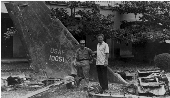
Meerdere vliegtuigen werden neergehaald bij hun poging om de Long Bien brug te vernietigen

Maar ik ga niet vooruitlopen op de volgende toespraak waarin kolonel Desair meer in detail zal gaan over de huidige manier van werken. U zult merken dat de Luchtmacht de nodige lessen heeft getrokken uit de dramatische interventie die hier 75 jaar geleden is gebeurd. Maar de heldenmoed die onze vliegeniers hier hebben betoond zullen en mogen we nooit vergeten.