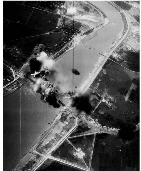
Pas vier jaar na de eerste bombardementen, werd de brug van Long Bien vernietigd met precisie geleide wapens

Het was pas in 1972, meer dan vier jaar na de eerste aanval, dat men de gepaste wapens heeft kunnen ontwerpen om dergelijke doelen te vernietigen. Dit is enkel mogelijk met precisie geleide wapens, die toelaten een brug te treffen op de meest kwetsbare punten. Vandaag is ook onze Luchtmacht uitgerust met dergelijke wapensystemen; en dit niet enkel om bruggen te vernietigen.