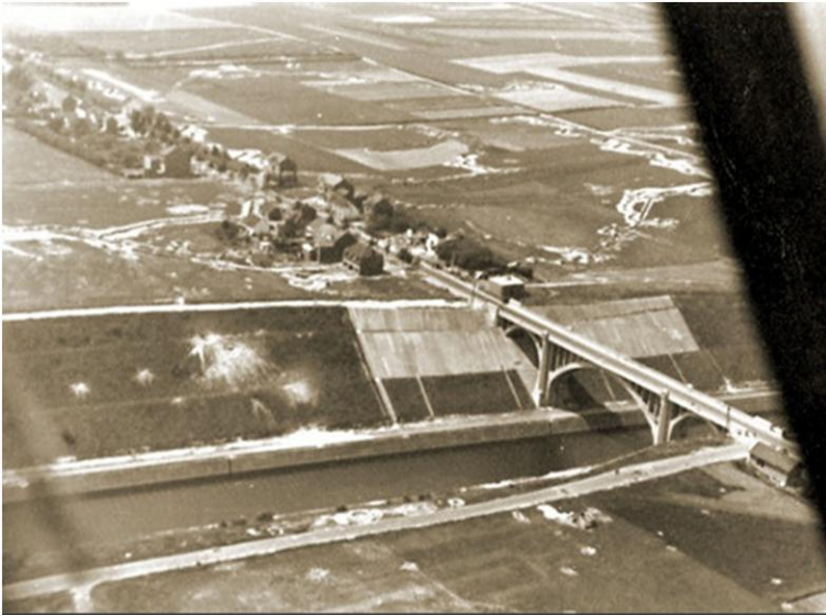
De brug van Vroenhoven, na de aanval

We hebben veel geleerd van het waagstuk dat zich hier, vandaag 75 jaar geleden, heeft afgespeeld.