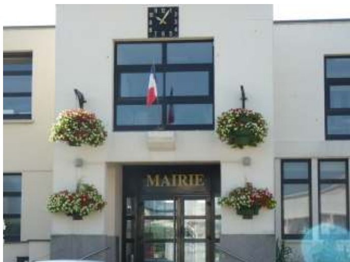
Mairie de Blériot Plage Gemeentehuis Blériot Plage

Grâce à l'intermédiaire de notre association, les descendants de la famille Bollekens étaient présents et nous avons donc pu assister près de cent ans plus tard à une rencontre historique entre ces deux familles.