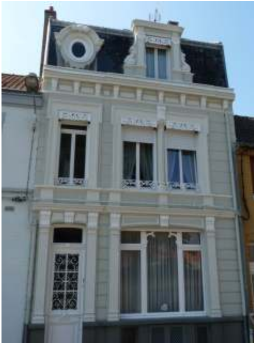
La maison familiale à Calais Het familiehuis te Calais