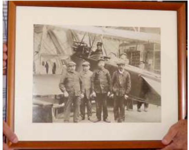
Les ateliers Legros - Bollekens en 1915 De werkplaatsen Legros - Bollekens in 1915