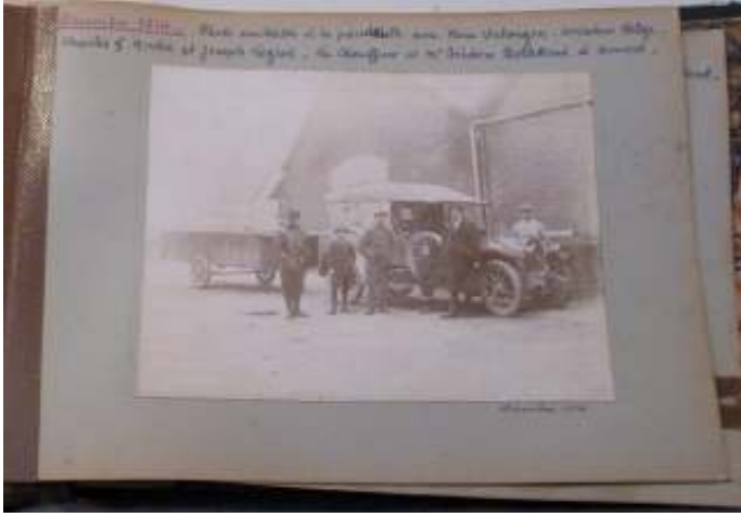
Album photo de la famille Legros Fotoalbum van de familie Legros