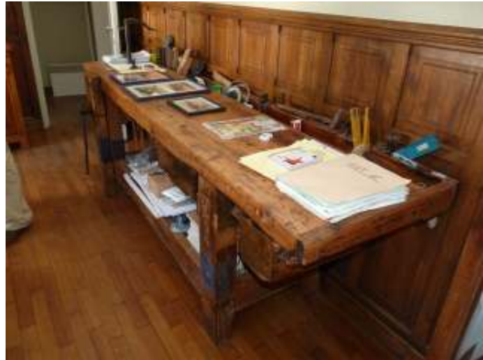
Les ateliers anciennement Legros, maintenant Cousin De vroegere werkplaatsen Legros, nu Cousin