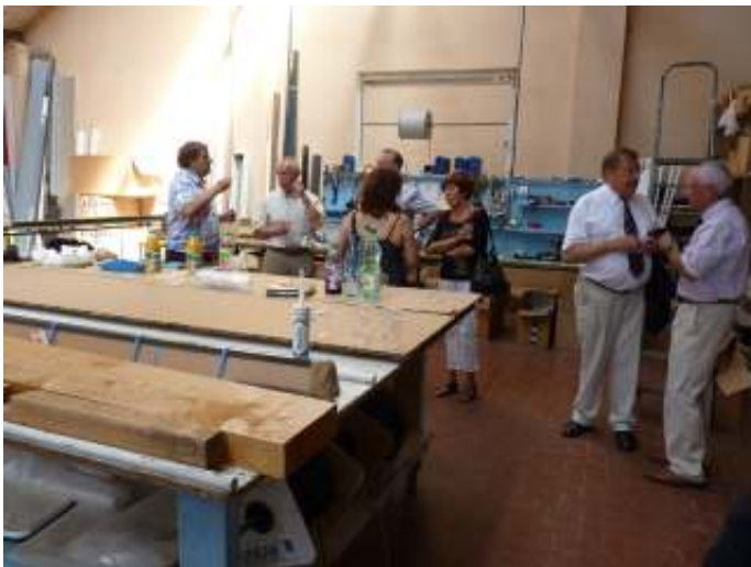
Un rafraîchissement avant la route du retour Een drankje voor de terugreis