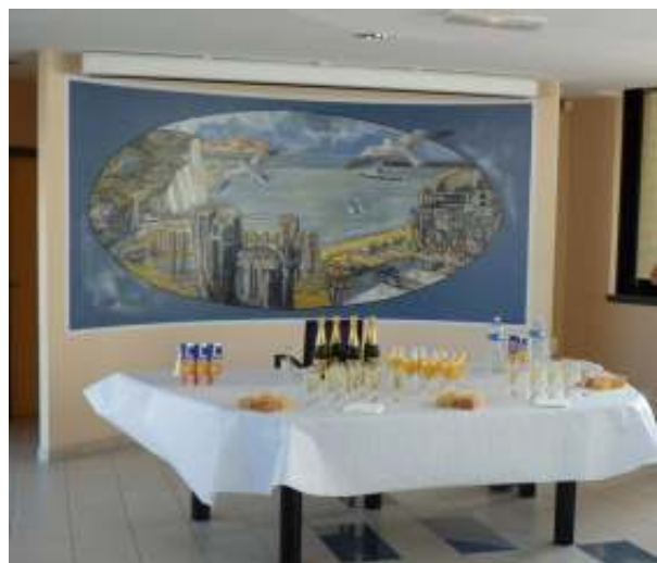
Réception à la mairie Receptie op het gemeentehuis