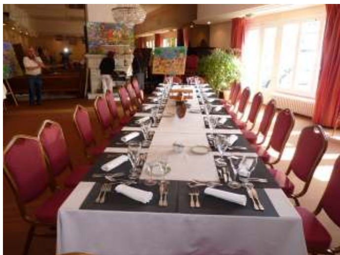
Restaurant de l'Hôtel des Dunes à Blériot Plage Restaurant l'Hôtel des Dunes te Blériot Plage